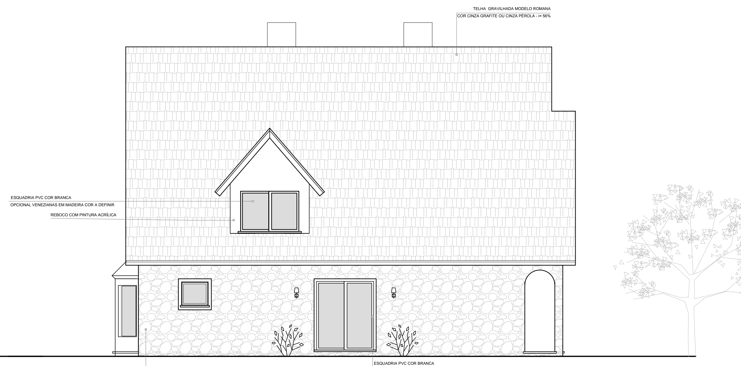
□ Vista Lateral Esquerda - Casa Modelo 03 ESCALA: 1/75