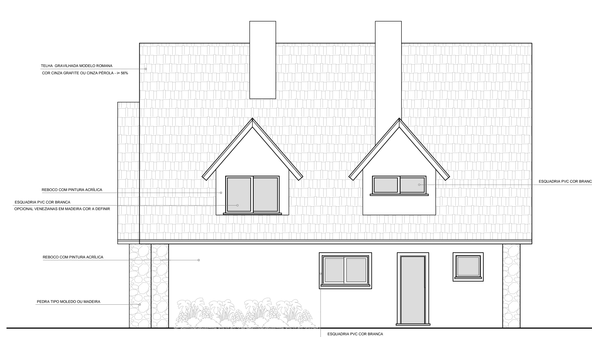
□ Vista Lateral Direita - Casa Modelo 03 ESCALA: 1/75