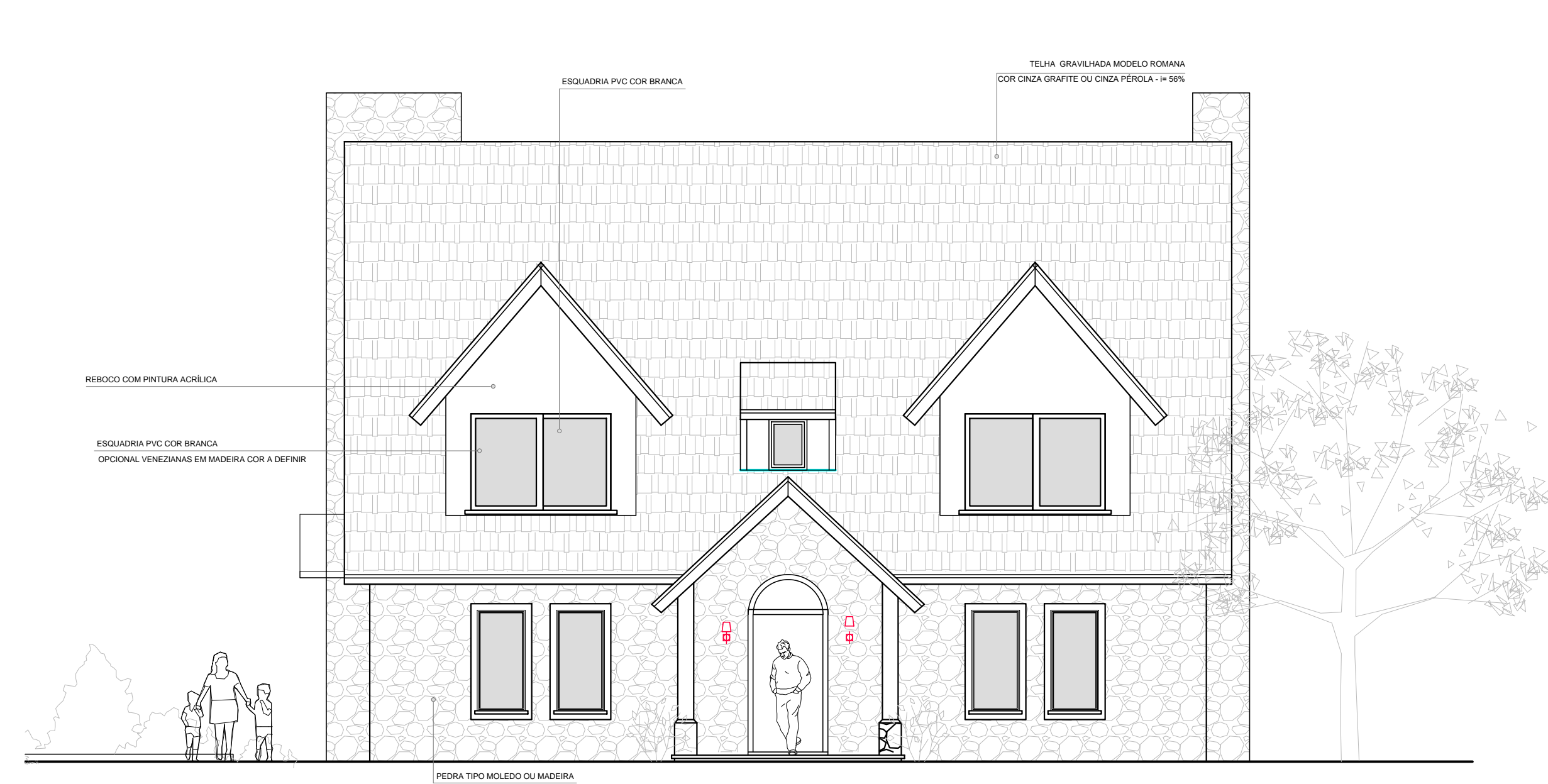
□ Vista Frontal - Casa Modelo 02 ESCALA: 1/75