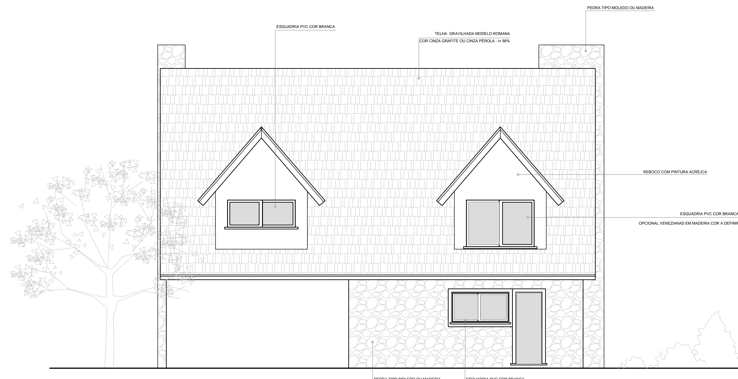
□ Vista Fundos - Casa Modelo 02 ESCALA: 1/75