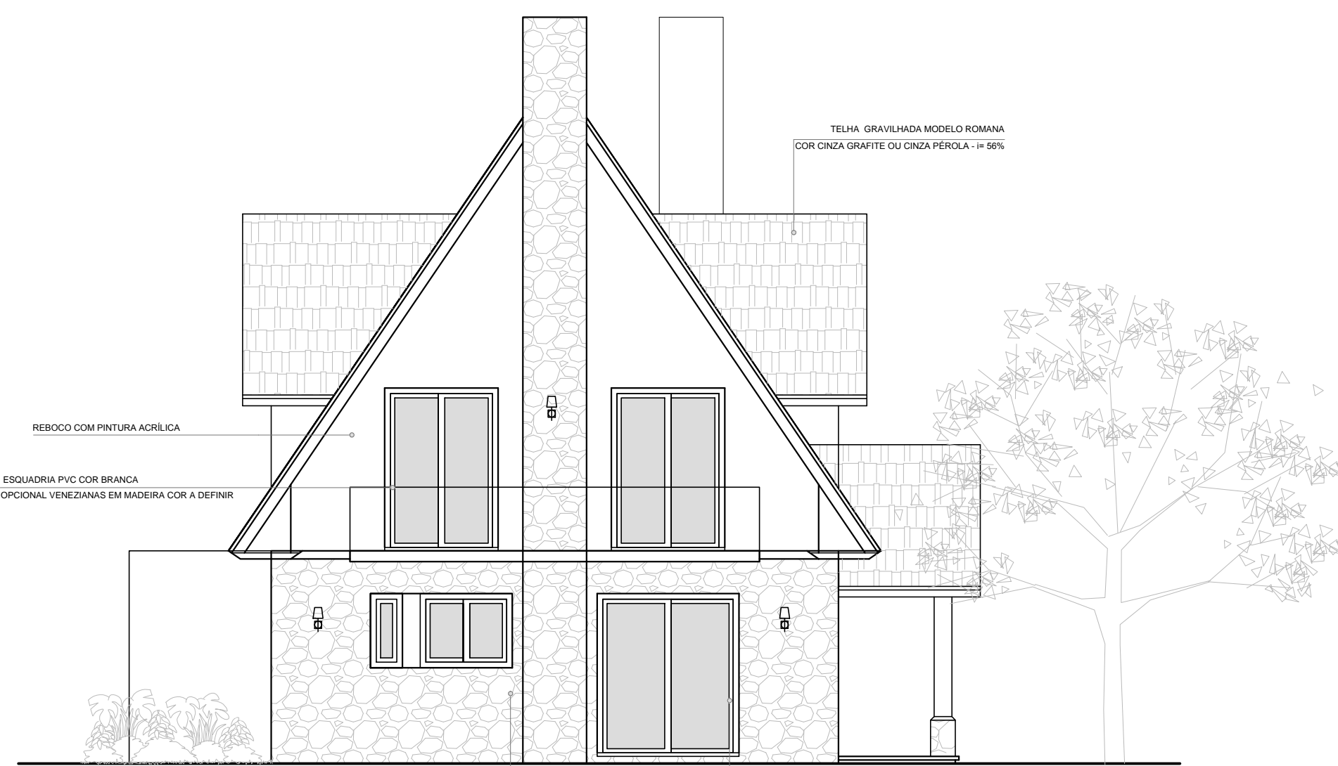
□ Vista Lateral Esquerda - Casa Modelo 02 ESCALA: 1/75