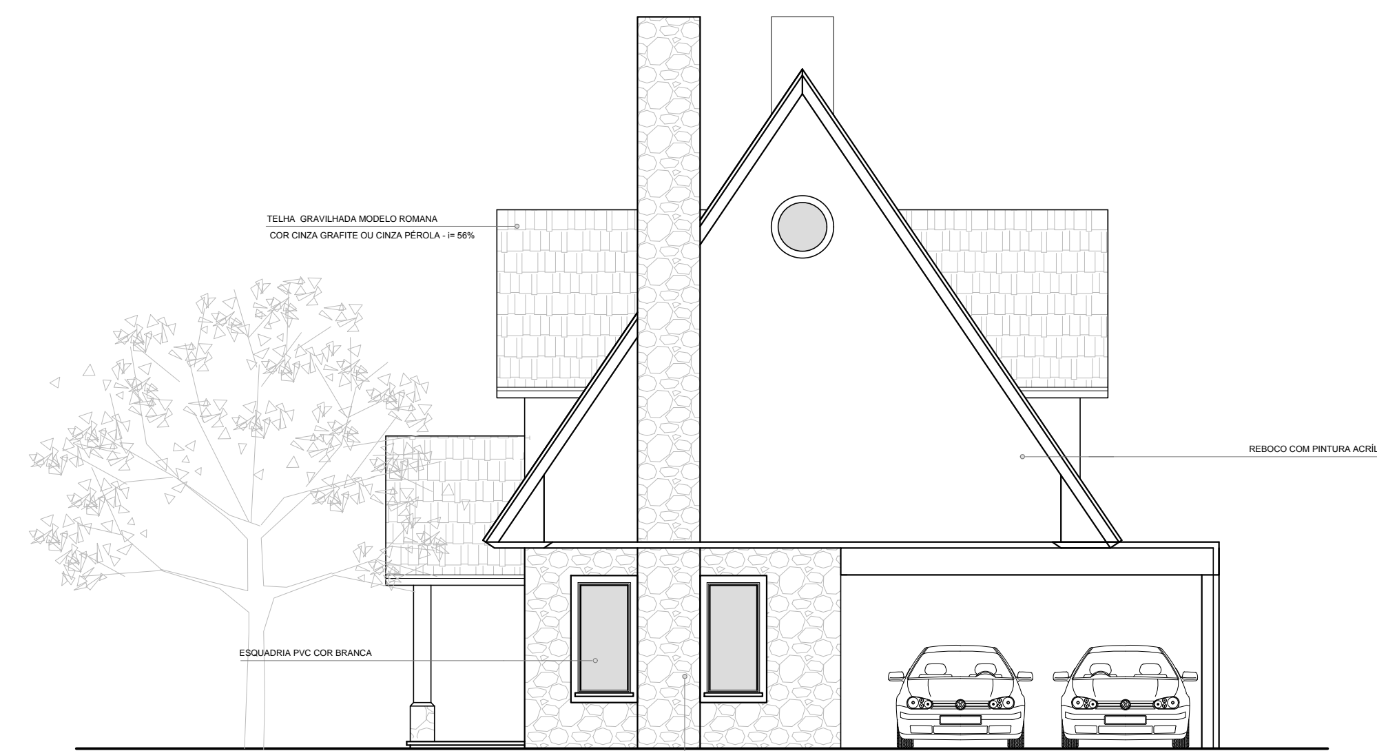
□ Vista Lateral Direita - Casa Modelo 02 ESCALA: 1/75